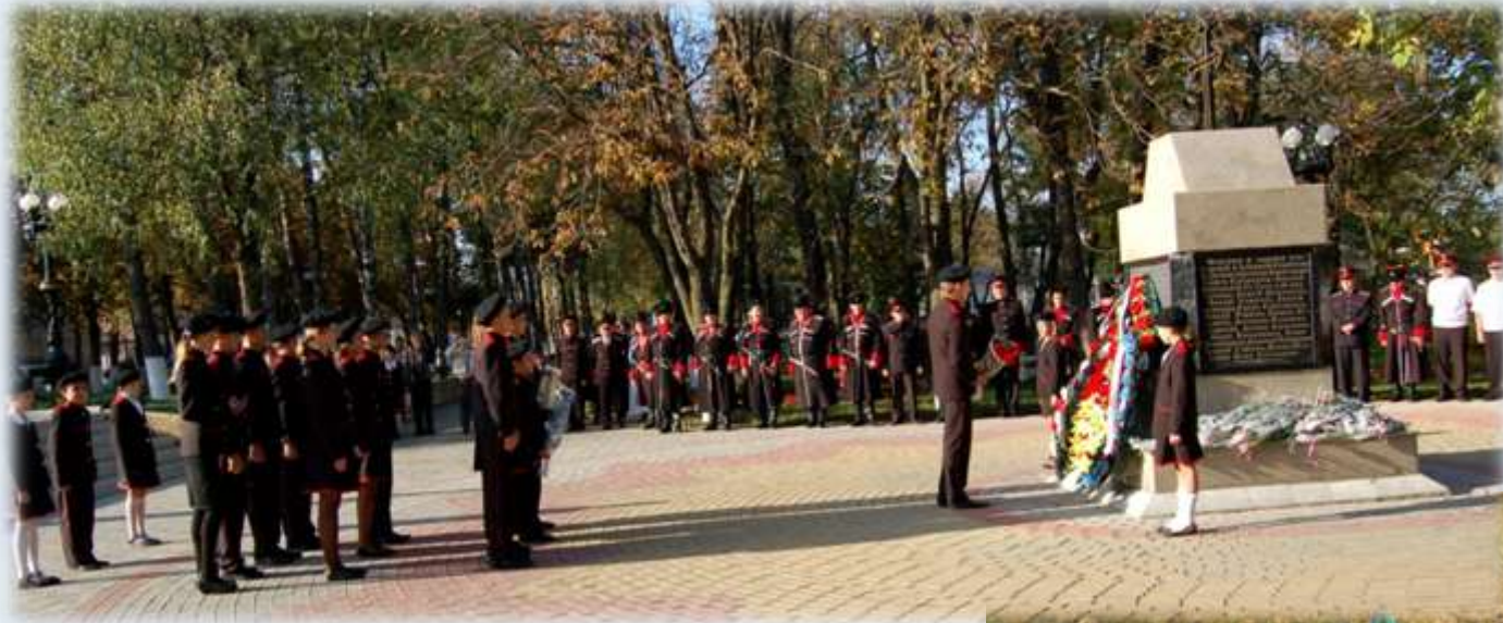
Пост казачьей славы